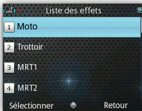
Choisir l'effet à reproduire