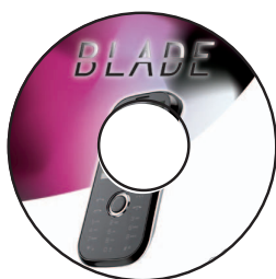
Cd con Phone Suite e Manuale d'Uso