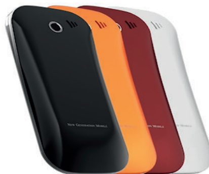
4 Back cover colorate