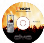
CD Phone Suite