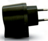
Caricatore da rete